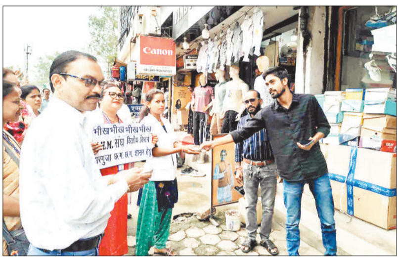
हरिभूमि न्यूज || अंबिकापुर

अपनी मांगों को लेकर अनिश्चितकालीन हड़ताल पर बैठे एनएचएम के कर्मचारियों ने शुक्रवार को अनोखा प्रदर्शन किया। एनएचएम के चिकित्सा, नर्सिंग स्टाफ व अन्य कर्मचारी हाथ में कोटरा लेकर सड़क पर निकले और भीख मांगा। संघ ने शहर के दुकानों, ठेले गुमटियों से भीख मांगकर अपना विरोध जताया। इतना ही नहीं कर्मचारी इस राशि को शासन के कोष में जमा कराएंगे ताकि शासन उन्हें नियमितीकरण का उपहार प्रदान करे।