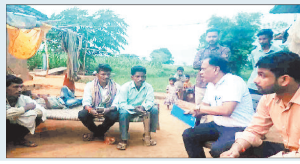
जहां चिकित्सकों द्वारा महिला का उपचार किया जा रहा था